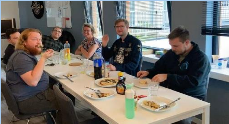
Gezamenlijke kookavonden in het Beschermd Wonen-project

Enkele bewoners hebben al zo'n mooie ontwikkeling doorgemaakt dat ze inmiddels het project hebben verlaten. Een aantal anderen zijn bijna zover. Zij moeten plaats maken voor mensen op de wachtlijst, die lang is en steeds langer wordt. Voor sommige kandidaten op de lijst is de woonbehoefte heel urgent. Hierbij doet een nieuw probleem zich nu voor: Door de extreme krapte op de woningmarkt lukt het de bewoners die kunnen doorstromen niet om een betaalbare woning te vinden. Zij zijn zelf verantwoordelijk om op zoek te gaan naar die woning als hun beschikking wordt afgebouwd, maar lopen vast. Het is hierbij van belang dat alle belanghebbende partijen (stichting Doorpakken, bewoners en ouders, de gemeente, het CMD, woonstichting 'thuis en zorgaanbieder RAC) samen optrekken om tot praktische oplossingen te kunnen komen. Als er per jaar één of twee bewoners een passende andere woning kunnen krijgen ontstaat er al de ruimte die we nodig hebben.